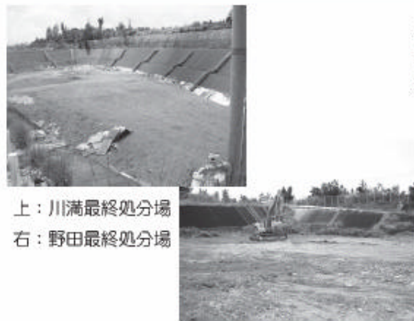
上: 川満最終処分場 右: 野田最終処分場

もらいたいと考えています。また、ごみ減量・リサイクル促進のための施策として、宮古島市では食品トレイ・発泡スチロール・剪定枝葉・廃食油の資源化をスタートさせました。今後、現在モデル事業を実施している生ごみの堆肥化や紙類のリサイクルを進め、ごみ減量化・資源化の一層の推進に取り組んでいきます。