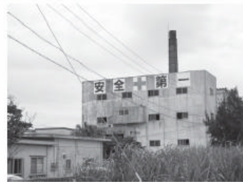
市クリーンセンター

設で対応しなければなりません。そのため、ごみの焼却量を減らし、稼働時間を短くして施設の延命化と経費抑制を図らなければなりません。また、ごみを燃やした後に残る焼却灰や燃やすことのできないごみ、資源化できないごみを埋め立てる最終処分場の延命化を図るためにも、ごみの減量は大変重要です。指定ごみ袋制によって市民一人ひとりに徹底したごみの分別・減量を実行して